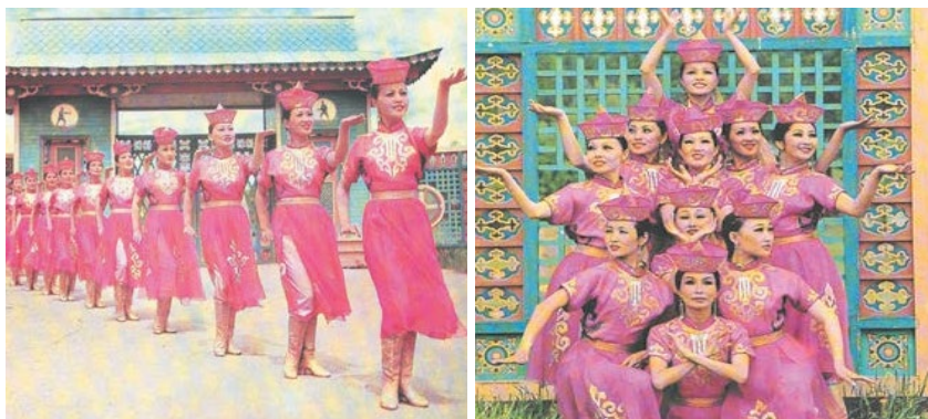
Танец «Наши девушки», исполняет женская группа ансамбля «Байкал».