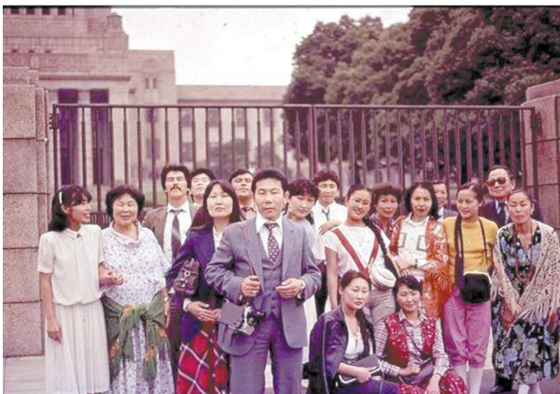
Гастроли ансамбля «Байкал» в Японии, 1983 г.