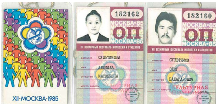
Удостоверения для пропуска на фестиваль молодежи и студентов в Москве 1985 г.