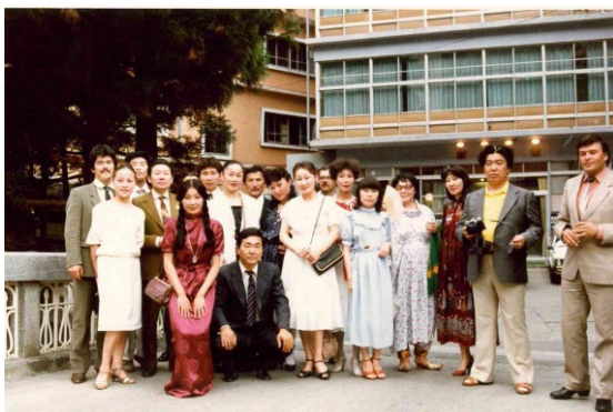
Гастроли ансамбля «Байкал» в Японии, 1983 г.