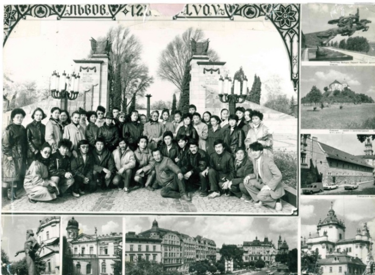
Гастроли. Украинская АССР