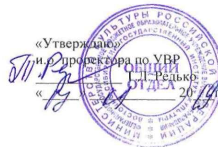
ГРАФИК ОТКРЫТЫХ ЗАНЯТИЙ КАФЕДРЫ театрального искусства и сценической речи на I полугодие 2019-20 учебного года